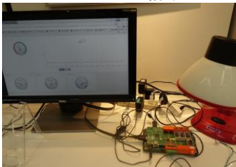
〈全業種〉 手軽に試せる IoTシステム構築キット