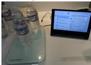
〈全業種〉 在庫管理・自動発注 システム