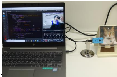
〈全業種〉 AIカメラによる 看板評価