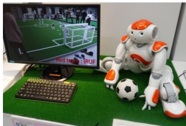
〈全業種〉 ロボットによるサッカー