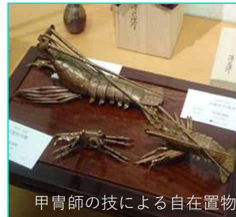
甲冑師の技による自在置物